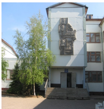
Наш второй дом—МКОУ СШ №4 г.Калача-на- Дону

В этом году исполнилось 27 лет со дня открытия нашей школы. Если вы спросите местных сторожков, то они вам ответят, что открытие школы состоялось словно вчера, хотя и прошло с того момента уже немало времени.