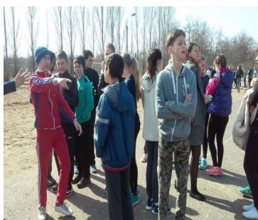
Перетягивание каната—дело непростое. Самое главное тут—правильно собрать команду.