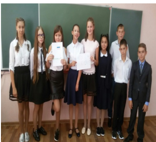
Так прошел классный час в 7а.