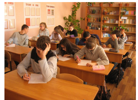
Учащиеся 8а класса пишут отзыв о рассказе «Ночь исцеления»

«Этот рассказ о сострадании, милосердии. Даже когда врачи