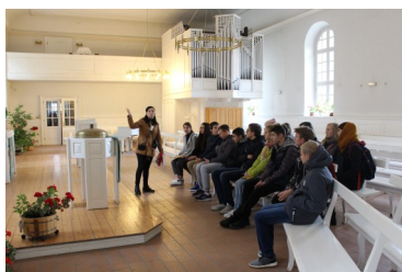
9б класс в гостях музея «Сарепта на Волге»