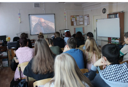
Екимовский урок в 9б классе

Для многих учеников это была первая встреча с рассказами Бориса Петровича и, надеемся, не последняя.