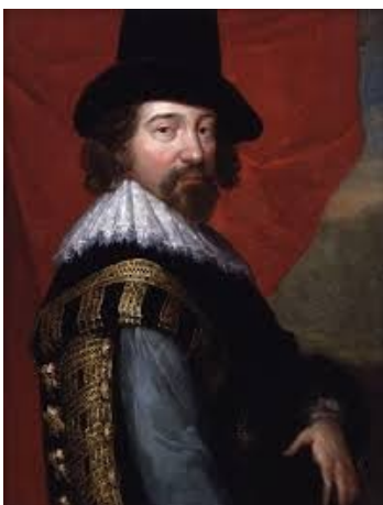
Английский историк, философ и политик Фрэнсис Бэкон

«Некоторые книги достаточно просто попробовать, другие хочется проглотить одним махом, а есть такие, которые приходится долго разжевывать и переваривать.»