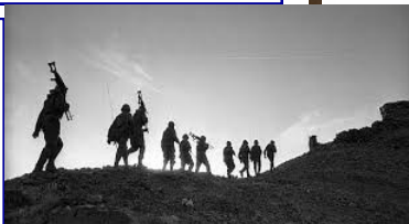
Кадры видеоролика, подготовленного учащимися.