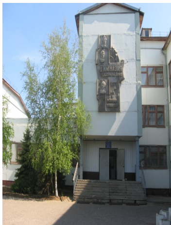
Наша родня школа

17 марта в нашей школе прошла интересная и полезная акция по озеленению школьного двора, в которой приняли участие будущие выпускники: ученики 10 и 11 классов. Такое мероприятие – прекрасная возможность внести свой вклад в благоустройство родной школы в Год экологии. Ведь зеленые насаждения помогают облагородить внешний вид территории и сохранить свежий и чистый воздух, который