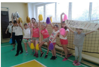
Поддержка—одна из составляющих успеха.

с закрытыми глазами. Если в первых трех конкурсах мальчикам для победы нужно было просто прийти первыми или выполнить задание качественно, то последний конкурс рисования был осложнен тем, что у ребят была повязка на глазах! Все эти сложности только усиливали интерес. Девочки и классные руководители поддерживали своих мальчишек: бурно кричали речёвки и участвовали в конкурсе чирлидинга, который тоже оценивался членами жюри. После всех испытаний подводились итоги, а парни в это время отдыхали и делились впечатлениями. Спустя некоторое время ведущие приглашали команды для объявления результатов, всем участникам были вручены грамоты победителей или призеров