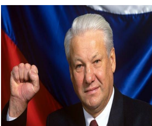
Б.Н.Ельцин—первый президент РФ.

18 марта 2018 года произойдет знаменательное для нашей страны событие - выборы президента Российской Федерации. Впервые Россия выбрала себе президента в 1991 году, тогда первым президентом