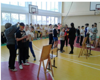
А вы бы нарисовали танк с завязанными глазами?