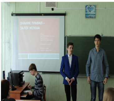
Информационный проект-победитель «Знаний правил—залог успеха».

18 марта в школе состоялся очный этап ежегодного фестиваля ученических проектов "Мои первые открытия". В этом году этот конкурс знаний и умений проходил уже в седьмой раз.