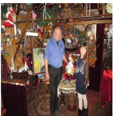
Хозяева комнаты грез.

Как часто мы восхищаемся всем, что далеко от нас и не замечаем того, что рядом.