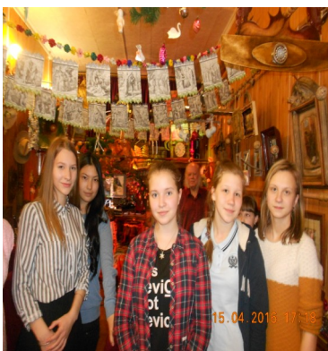
Ученицы 9а класса в Волшебном фонаре.