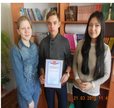
Победители, представившие проект «Портрет слова».

«Уже в седьмой раз наша школа проводит конкурс знаний и умений - фестиваль «Мои первые открытия.»