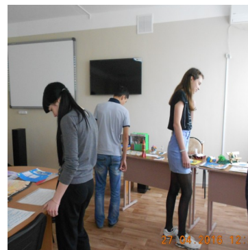
Ученики 9а класса рассматривают экспонаты выставки «Форум знаний».