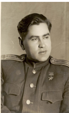
А.П.Маресьев в конце войны.

войны у А.П.Маресьева были ампутированы обе ноги. Однако, несмотря на инвалидность, лётчик вернулся в небо и летал с протезами. Всего за время войны совершил 86 боевых вы-