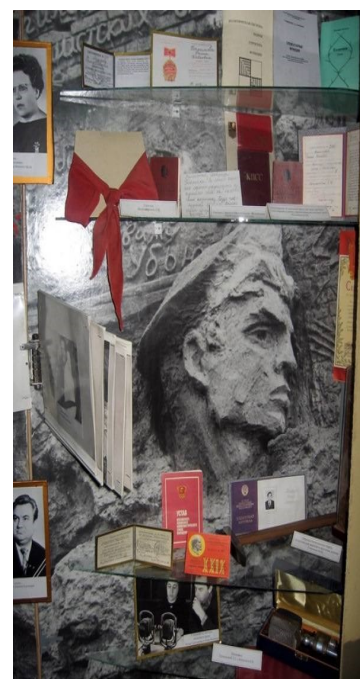
Наш школьный Краеведческий музей