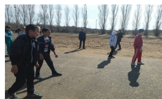
И напоследок - подвижные игры!

мательных «Весёлых стартов» все учащиеся сыграли в «Вышибалы». Участники соревнований получили заряд бодрости и хорошего настроения на весь день и оставшиеся уроки.