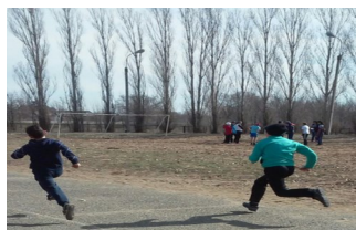
Учащиеся 6-х классов соревнуются в скорости и ловкости.

В Акции приняли участие все ребята нашей школы с 1 по 11 класс. Старшеклассники под руководством учителей по физической