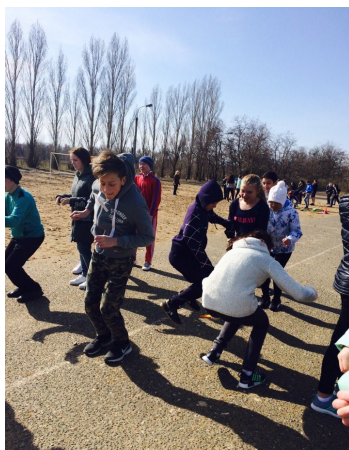
Один за всех и все за одного! Ребята продемонстрировали командный дух.

7 апреля 2017 года в нашей школе, как и в других учебных организациях, прошла акция, посвященная Всемирному дню здоровья. Ежегодное проведение дня здоровья вошло в традицию с 1950 года. Цель мероприятия заключается в том, чтобы люди могли понять, как много здоровье значит в их жизни. Каждый год выбирается новая тема, которая является девизом этого праздника. В этом году темой Дня здоровья стала такая важная проблема, как депрессия.