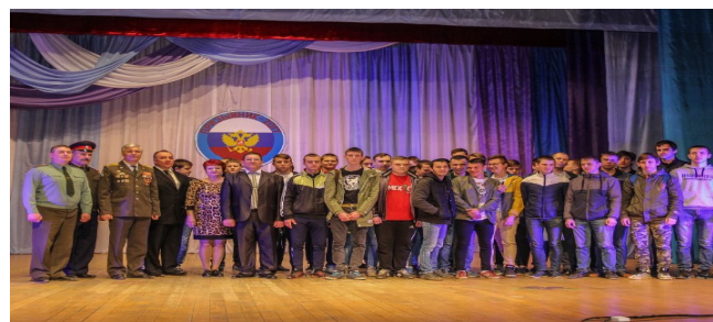
Будущие защитники нашей Родины отметили «День призывника»

Несмотря на то, что событие это является довольно мо- лодым, за ним уже за- крепились свои тради- ции. Различные празд- ничные мероприятия организуются во мно- гих городах военкома- тами и администраци- ей. Одно из таких ме-