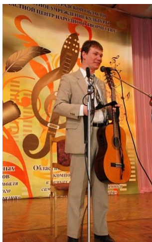
Участник конкурса «Муза юности» демонстрирует свои таланты