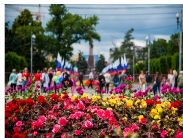
В Волгограде 1 мая необыкновенно весело, красочно и дружелюбно.