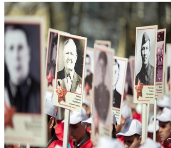
Акция «Бессмертный полк» становится все масштабнее и масштабнее с каждым годом.

принесли много горечи и боли людям. Мы не вправе забывать то, за что бесстрашно сражались наши деды и прадеды. Именно благодаря их бесценному подвигу мы сейчас можем любоваться мирным и чистым небом над голубой.