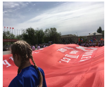
Парад Победы 2018г. в нашем городе.

В нашей школе тоже помнят и чтуют великую победу: проводятся классные часы, посвящённые Дню Победы. Различные тематические конкурсы вызывают немалый интерес у школьников, наиболее занятыми считаются такие, как: «Письмо ветерану», «Открытка для ветерана» и другие. Ребята учат песни и стихотворения о войне, исполняя их на разного рода мероприятиях и конкурсах.