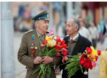
«Никто не забыт! Ничто не забыто!»